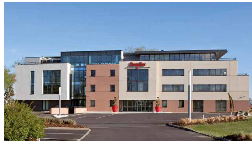
SIÈGE DU GROUPE STRADIM

Stradim compte aujourd'hui plus de 100 collaborateurs, développeurs fonciers, architectes, économistes de la construction, responsables de travaux, conseillers commerciaux, mobilisés pour la réalisation des projets d'acquisition de résidence principale ou d'investissement dans la pierre de nos clients. Chaque futur propriétaire ou investisseur bénéficie de conseils avisés et personnalisés pour se constituer un patrimoine solide, rentable et durable.