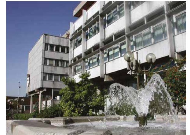
Mairie de Schiltigheim