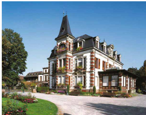
Parc du Château de Schiltigheim