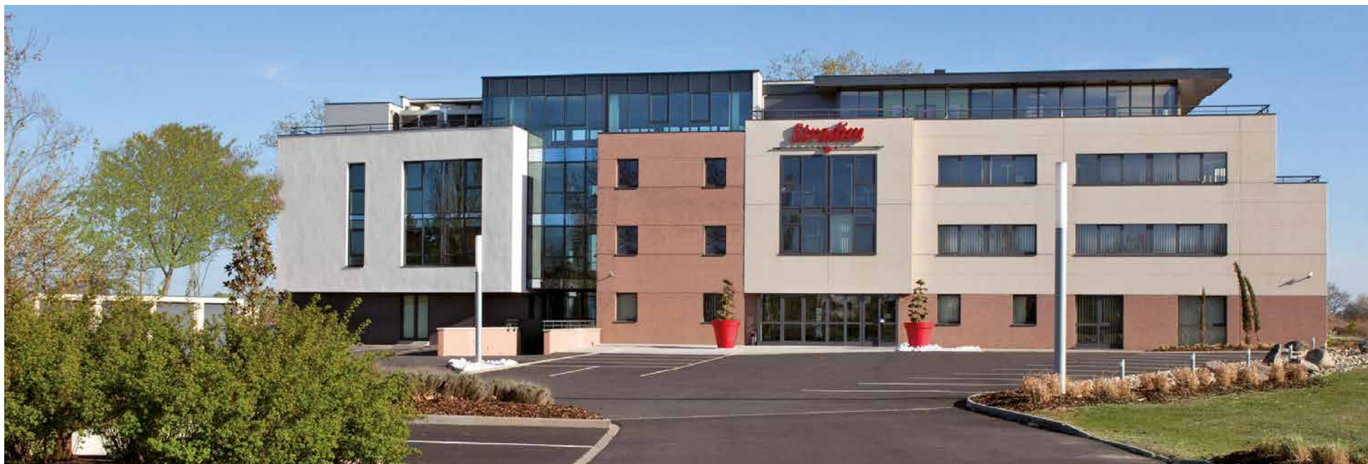
Siège social du Groupe – Aéroport de Strasbourg-Entzheim