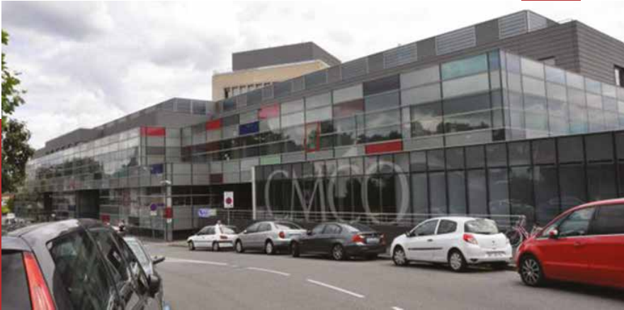
CMCO - Centre Médico-Chirurgical et Obstétrical à Schiltigheim