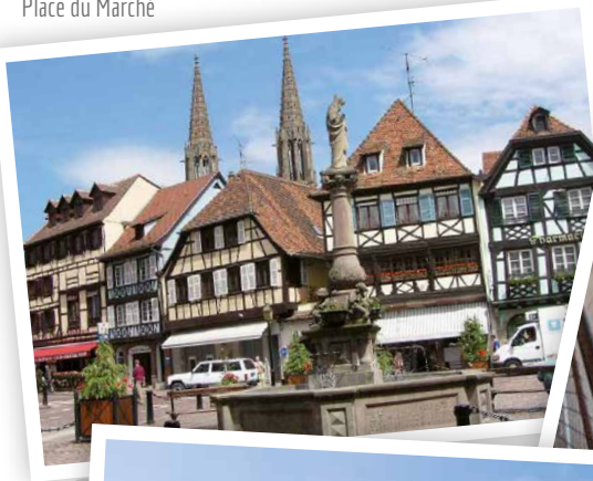
Place du Marché