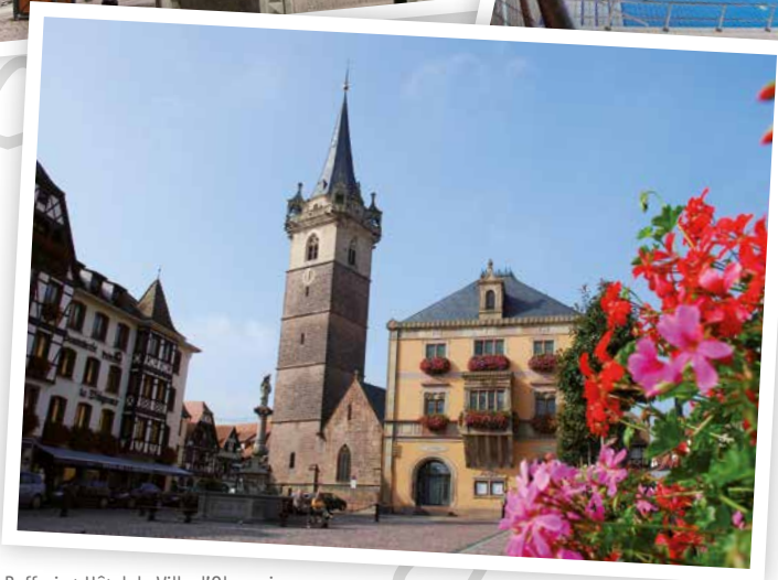
Beffroi et Hôtel de Ville d'Obernai

Obernai Capitale du Piémont des Vosges, s'illustre par un pôle d'attractivité économique hors du commun. Avec plus de 560 entreprises qui innovent, investissent et s'impliquent au quotidien dans le tissu économique de la ville, c'est plus de 9 000 emplois pourvus sur la commune pour un peu plus de 11 000 habitants.