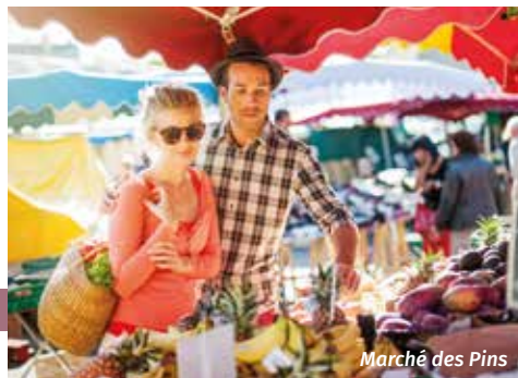
Marché des Pins

Depuis la pointe de Mindin jusqu'aux dunes de l'Ermitage, le littoral de caractère de la Côte de Jade et ses plages de sable fin séduiront tous les amoureux de nature, qui pourront également se ressourcer à l'ombre des pins maritimes de la forêt dunaire auxquels la ville doit son nom.