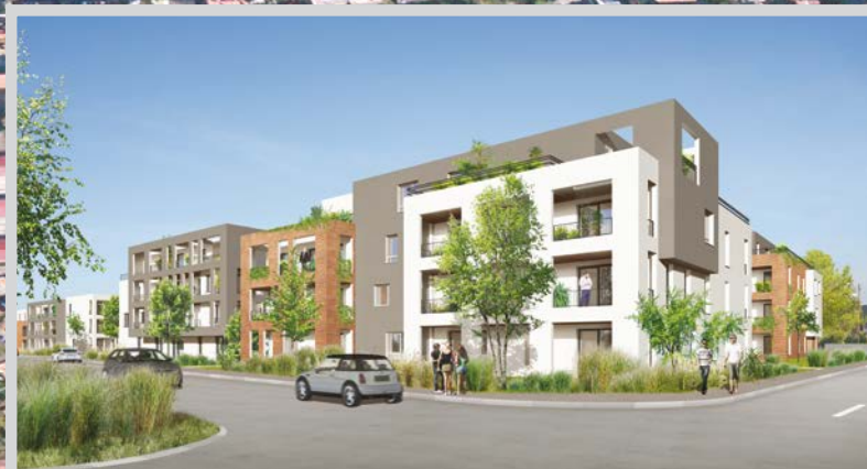
LE DOMAINE DE L'EMPEREUR