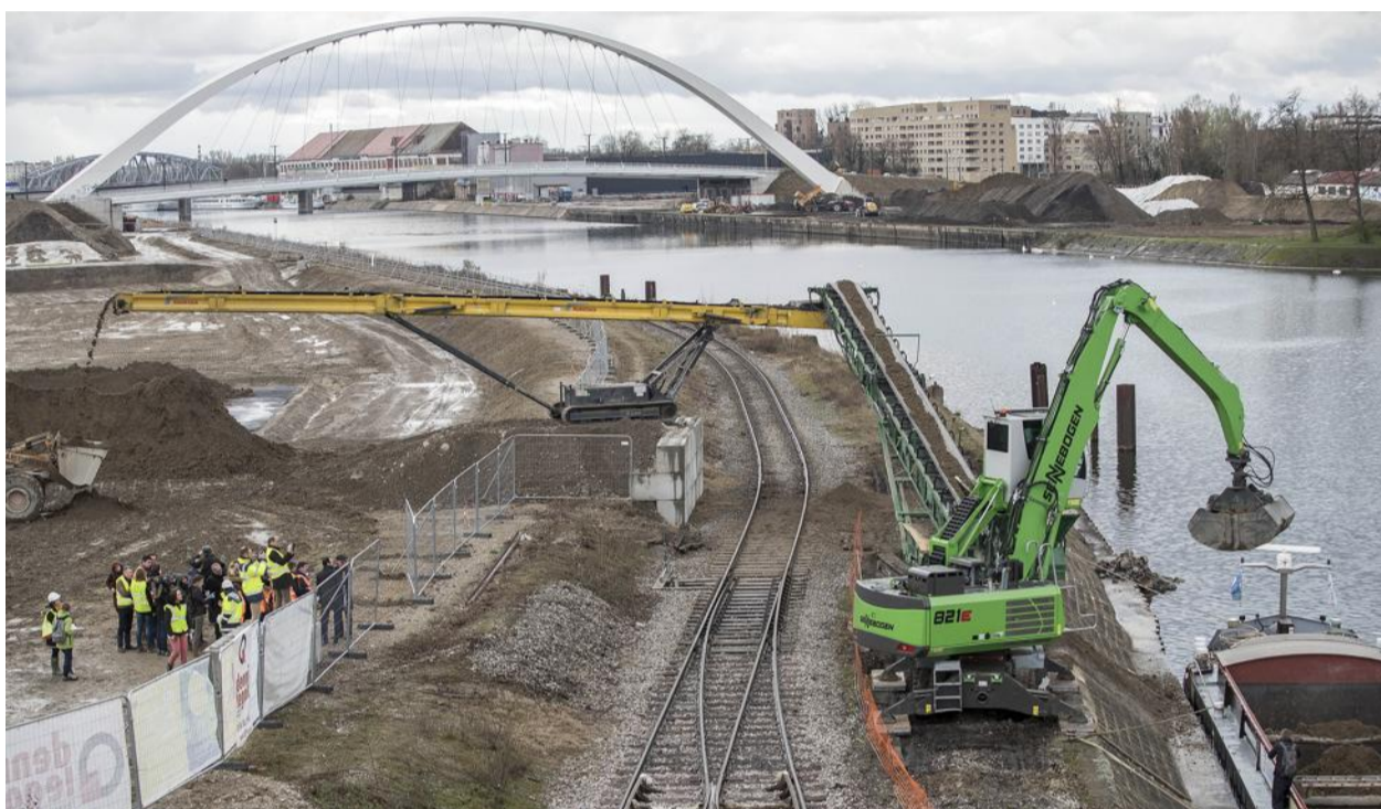
Le site de déchargement de la péniche le long du quai du môle Starlette. Au fond, le môle Citadelle.

Les opérations de dépollution des sols du secteur Starlette ont débuté. Deux plateformes de remise en état des sols vont être mises en activité sur les môles Starlette et Citadelle pendant deux à trois ans. Une péniche assurera la liaison.