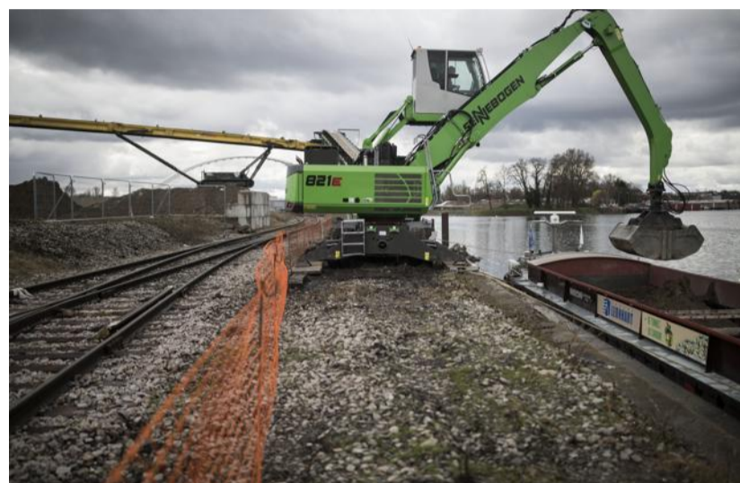
Le transport de la terre par péniche va faire économiser 8000 trajets en camion, selon les calculs de la SPL des Deux Rives.

Le secteur des Deux-Rives est un grand bout de ville avec un passé industriel et portuaire et un avenir à créer : 74 hectares de friches à reconquérir. Des friches « industrieloportuaires », dit la SPL des Deux Rives (*). Et qui dit friche industrielle et portuaire dit sol pollué à dépolluer. La SPL, en partenariat avec Voies Navigables de France (VNF) et le Port autonome a lancé officielle-