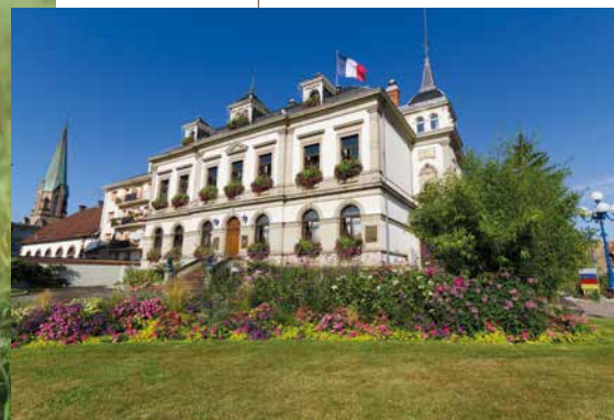
Mairie de Bischheim

Le programme bénéficie d'une excellente desserte en transports en commun, grâce à une ligne de bus à proximité immédiate et à une station de tram à quelques pas, facilitant vos déplacements quotidiens.