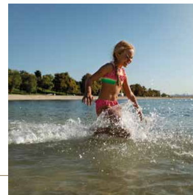
Plan d'eau de la Ballastière