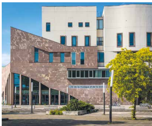
Cité de la musique et de la danse