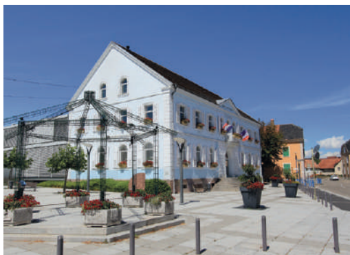
Mairie de Wittenheim

La ville est généreusement dotée en infrastructures culturelles et sportives, qui sont autant d'invitations à la détente : médiathèque, cinéma, école de musique, nombreux complexes sportifs et stades... Avec 13 établissements scolaires jusqu'au lycée, et de multiples possibilités de garde, Wittenheim se prête à l'organisation d'une vie familiale sereine. Commerces et services de proximité simplifient le quotidien et le marché hebdomadaire permet l'approvisionnement en produits frais et de saison.