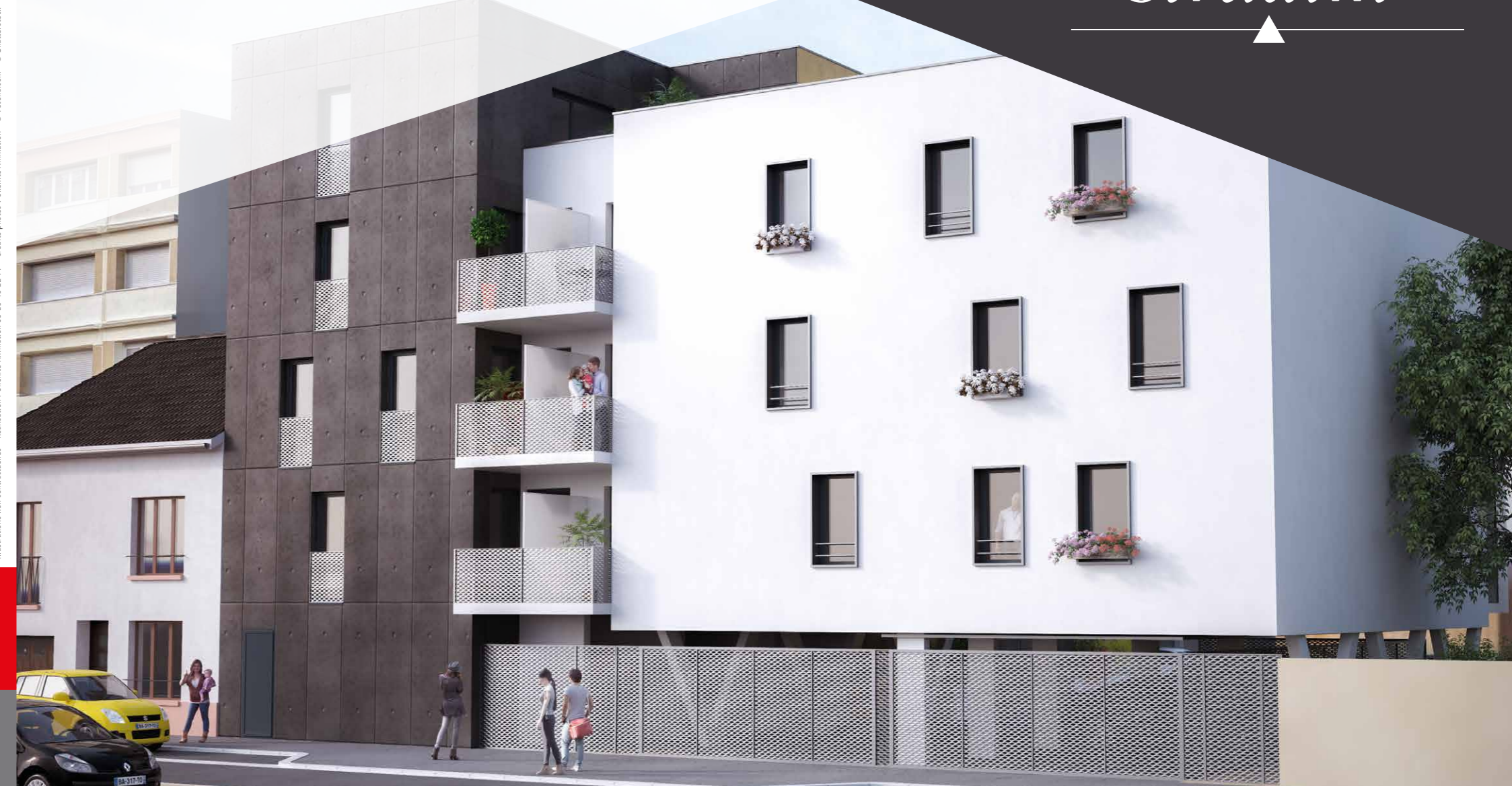
Illustrations non contractuelles - Réalisation : Okérite Animation 03 25 45 12 77

POUR PLUS D'INFORMATIONS, CONTACTEZ OU RENCONTREZ NOS CONSEILLERS COMMERCIAUX